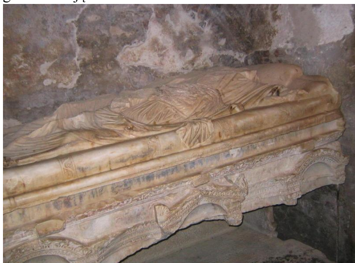
Grób Świętego Mikołaja – bazylika pod jego wezwaniem w Bari, Włochy

W czasie prześladowania, jakie wybuchło za czasów cesarza Dioklecjana i Maksymiana (początek IV wieku), Święty był więziony. Uwolnił go dopiero edykt mediolański (rok 313). Uczestniczył także w pierwszym soborze powszechnym w Nicei (rok 325). Mikołaj zmarł 6 grudnia mając 72-80 lat.