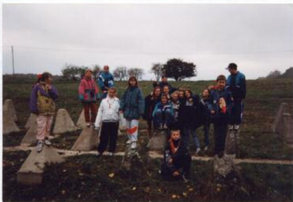
Fot. 4. Na „zębach smoka”

kryjówek stwarzają odpowiednie warunki do hibernacji.