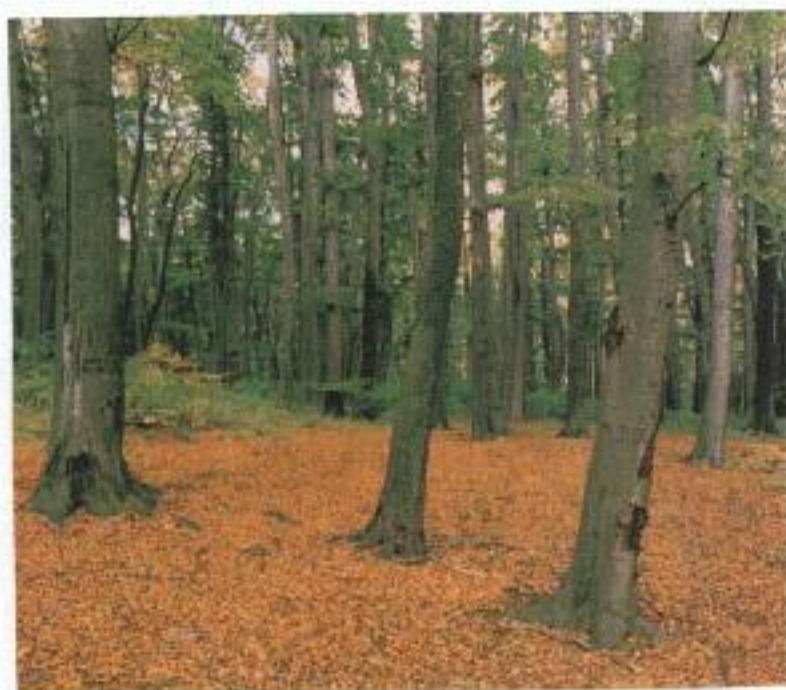
fol. 13. Fragment buczyny.

już co roku członkowie SK LOP biorą udział w konkursie przyrodniczym zorganizowanym przez ZG LOP. Tym razem uczestnicy pisali swoje prace na ciekawy temat związany z pracą leśnika - „Cytowiska lasu”, pt.