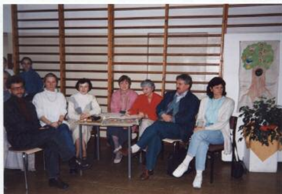
fot. 14. Jury ekoturmieju.

sama przyroda. Dzieci składali przyrodnicze ślubowania, rozpoznawali chronione gatunki roślin i zwierząt, projektowali plakietki ekologiczne i