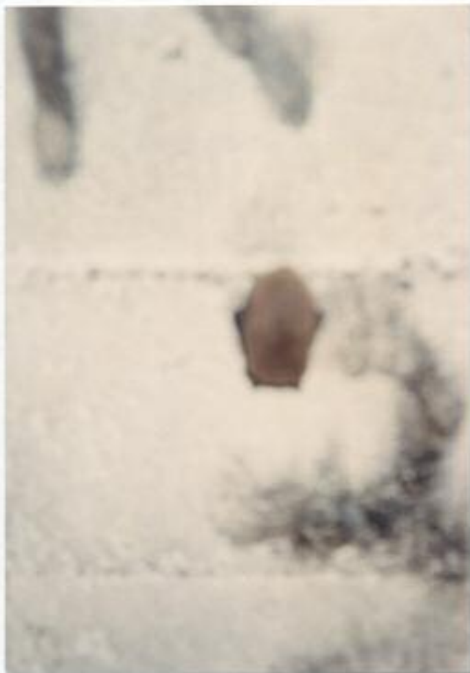
fot. 6. Jeden z nietoperzy MRU (nocek rudy).

Podziemia MRU i nietopere nie wywarły ogromne wrażenie na młodzież z LOP. Z pewnością nie będą koja- rzyć nietoperzy ze strasznymi i krwiożerczymi „wampirami”, ale z barcho miłymi i poży- tecznymi ssakami. Prawdopodobnie stali się ich nowymi przyjaciółmi.