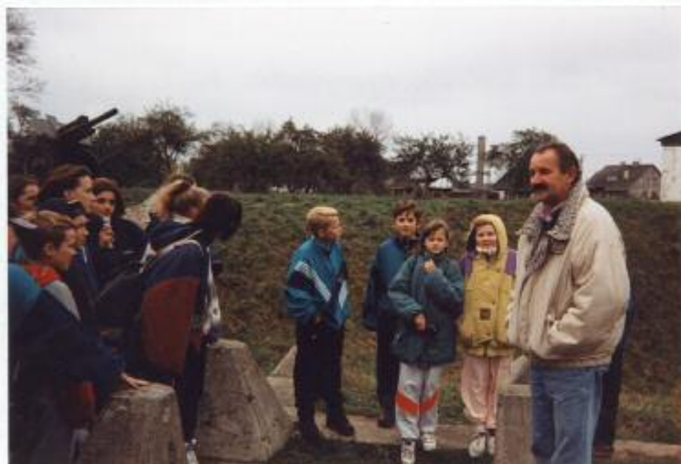
Fot. 2. Przewodnik opowiada historię MRU.

Międzynecki Rejon Umocnień (MRU) został zbudowany przez Niemców w latach międzywojennych i II wojny światowej. Większa część podziemi byłego MRU, znajduje się obecnie na terenie województwa gorowskiego w gminie Międzynecz. Niewielki południowy fragment znajduje się w województwie zielonogórskim w gminie Lubna. Podziemia zajmują obszar rozciągający się południkowo na długości ok. 10 km dochodząc na północy w rejon wsi Kęszycę, na południu w rejon Boryszyna i Staropola. Podziemia tworzy system żelbetonowych korytarzy znajdujący się na głębokości ok. 30 m pod powierzchnią ziemi.