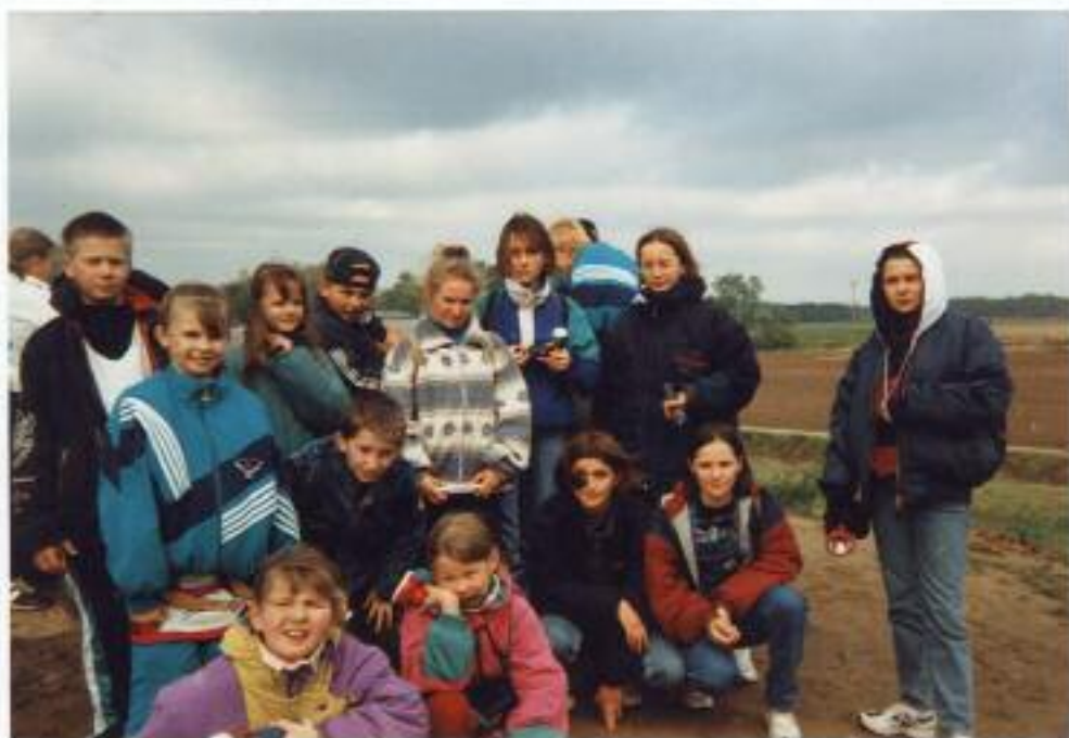
fot. 7. Przed wejściem do podziemi.

Wycieczka do Nietoperka była świetnym połączeniem nauki i zabawy, a przywiezione z niej zdjęcia porastają miłym wspomnieniem z wyjazdu.